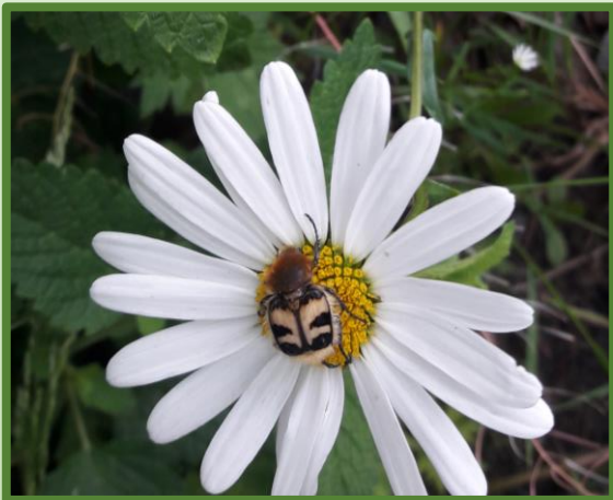
Wer landet in der Blume?