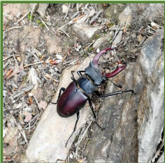
Wer wandert da lang?