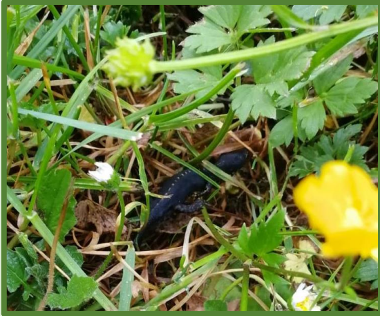
Wer krabbelt im Gras?